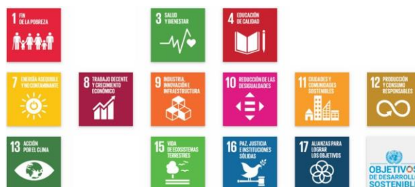
Gráfico 3 conexidad del proyecto con los Objetivos de Desarrollo Sostenible – ODS.